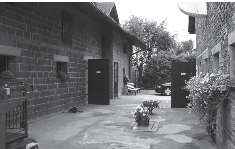
Czyste, estetyczne i ukwiecone podwórko

w procesie pracy w gospodarstwach rolnych oraz wyłonienie gospodarstw mających osiągnięcia we wdrażaniu tych zasad. Patronat honorowy nad tegoroczną edycją konkursu objął Prezydent RP, a patronat medialny - Telewizja Polska oraz redakcje gazet - Agroserwis, Agromechanika i Zielony Sztandar. W 2011 roku do konkursu przystąpiło 1 218 uczestników.