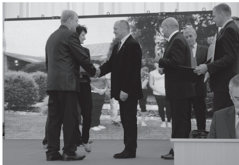
Gratulacje od Ministra Sawickiego

W gospodarstwie panuje wręcz wzorowy ład i porządek jak i troska o bezpieczeństwo pracy. W tym miejscu należy może przypomnieć, że celem Ogólnokrajowego Konkursu „Bezpieczne Gospodarstwo Rolne”, którego organizatorami są: Ministerstwo Rolnictwa i Rozwoju Wsi, Kasa Rolniczego Ubezpieczenia Społecznego, Państwowa Inspekcja Pracy, Izba Rolnicza oraz wojewódzkie ośrodki doradztwa rolniczego jest promocja zasad ochrony zdrowia i życia