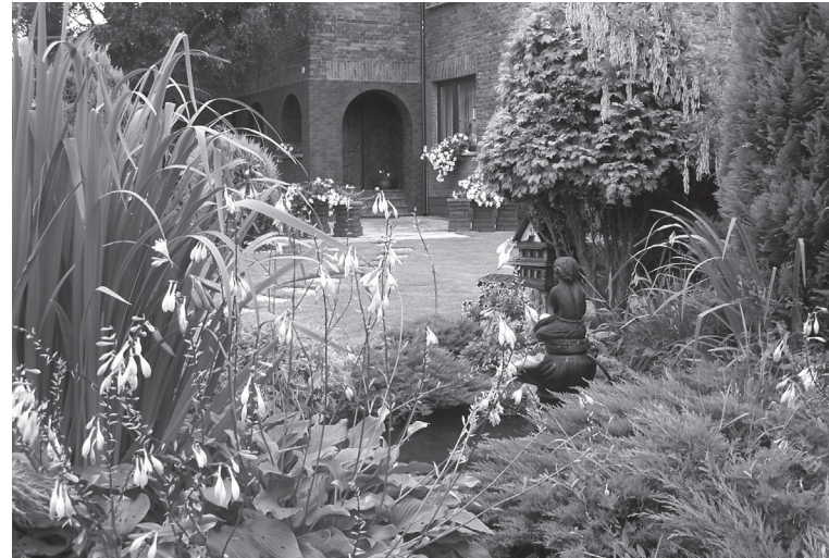
Piękny ogród otaczający dom